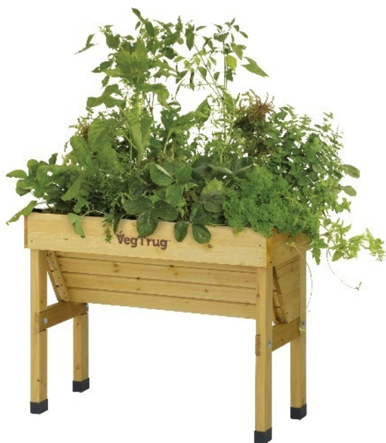
【ホームベジトラグ ウォールハガー-S】