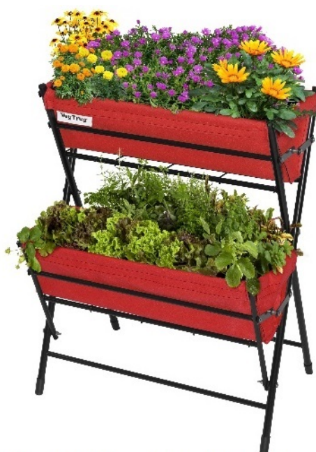
【ベジトラグ ポピー 2ステップス レッド】

当社のガーデニング用品の中でも一番の人気を誇る『VegTrug® (ベジトラグ)』シリーズはイギリス発祥の“レイズドベッド”といわれる床面を高くした花壇を指します。ガーデニング先進国でもあるイギリスで商品企画された同シリーズはオーガニック食品、LOHAS、地産地消といった安心安全な野菜へのニーズが高まったことから生まれました。ちょっとしたスペースでも簡単に菜園を作ることができ、日本でも今イチオシの商品となっております。